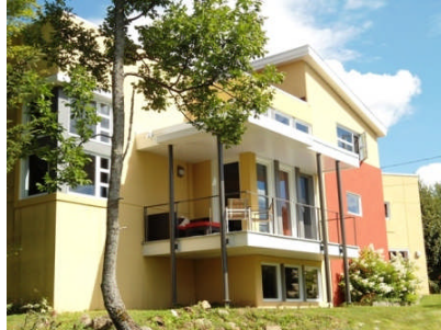
Résidence/Office Charest Parenteau