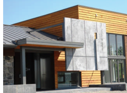
Résidence Moulton Hill

Des architectes venant des quatre coins des Amériques se sont réunis vendredi le 7 décembre dernier au J W Marriott Grosvenor House Hotel, Park Lane, à Londres pour assister à l'annonce des lauréats du AMERICAS PROPERTY AWARD, en collaboration avec the Royal Institute of Chartered Surveyors (RICS) et Yamaha.